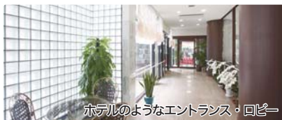
ホテルのようなエントランス・ロビー