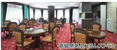
高級感あふれるレストラン