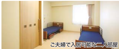
ご夫婦が入居可能な二人部屋

低価格なのに高級感あふれる佇まい 万全の介護サービスで皆様に感動と安心をご提供いたします